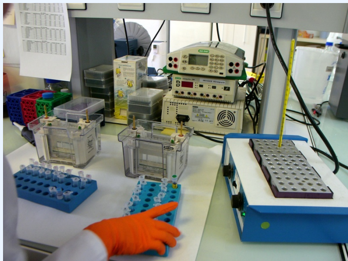
Les Laboratoires de Neovacs.

A propos de l'étude de Phase I/II avec le TNF \alpha -K dans la maladie de Crohn : Cette étude de Phase I/II est une étude ouverte, non-comparative, à dose croissante (60, 180, 360 mcg de TNF-K), avec administration de 3 doses (à 0, 7, 28 jours) ou de 4 doses (à 0, 7, 28, 168 jours) sur un effectif de 21 patients souffrant d'une maladie de Crohn modérée à sévère. Deux patients ont reçu 3 doses de 60 mcg, un troisième a reçu 4 doses de 60 mcg, sept patients ont reçu 3 doses de 180 mcg, deux ont reçu 4 doses de 180 mcg et sept patients ont reçu 3 doses de 360 mcg - que les 2 derniers patients recrutés vont aussi recevoir. Aucun EIG (Événement Indésirable Grave) lié au produit n'a été déclaré et aucun des patients n'est sorti prématurément de l'étude pour des raisons de tolérance ou de sécurité. Cette étude vise principalement à évaluer l'innocuité du Kinoïde et sa capacité à induire une réponse immunitaire dirigée contre le TNF \alpha (facteur de nécrose tumorale alpha). L'un des objectifs secondaires est d'observer l'effet thérapeutique, mesuré par le score clinique de la maladie ainsi que par des marqueurs de l'activité de la maladie.